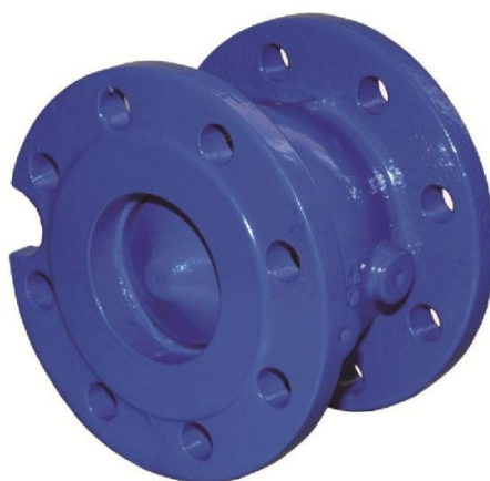
Na zdjęciu DN100