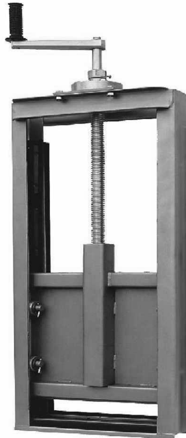
Fot. Zastawka kanałowa typ TZK.