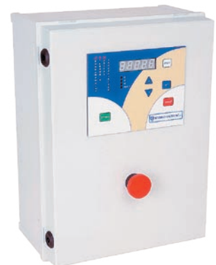
:: Urządzenie zabezpieczająco-sterujące UZS.5