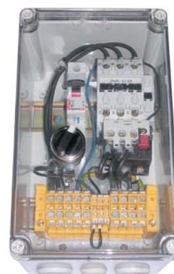
:: Urządzenie zabezpieczająco-sterujące UZS.1