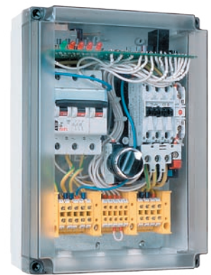
:: Urządzenie zabezpieczająco-sterujące UZS.4