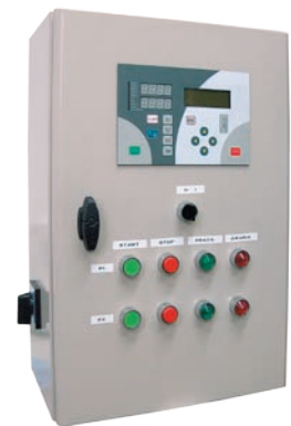
:: Urządzenie zabezpieczająco-sterujące UZS.8