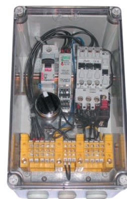
:: Urządzenie zabezpieczająco-sterujące UZS.2