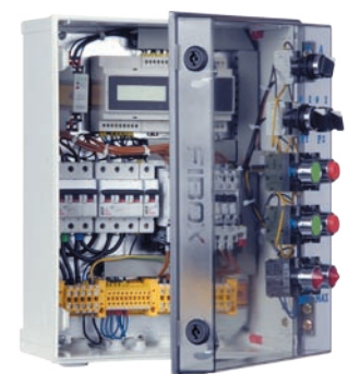
:: Urządzenie zabezpieczająco-sterujące UZS.7