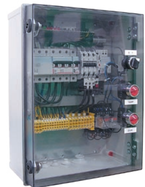
:: Urządzenie zabezpieczająco-sterujące UZS.6