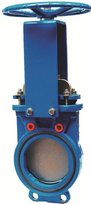
Na zdjęciu DN200