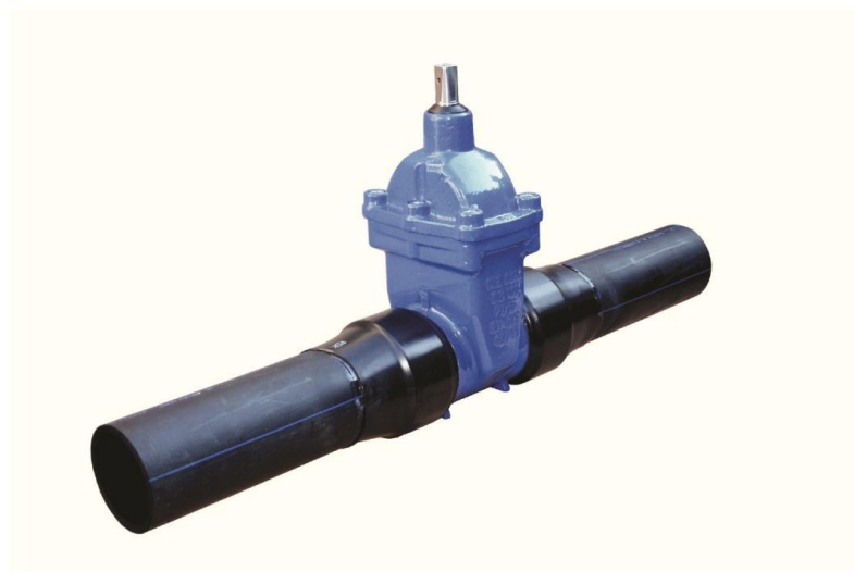
Na zdjęciu DN100